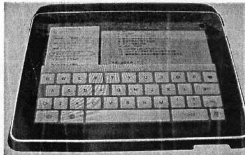
便利なシステムノート