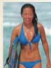
プロ・ロングボーダー 奥山千晶