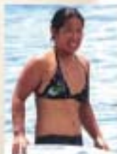
プロ・サーファー 谷口絵里菜